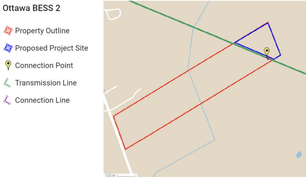
Figure 1 : Carte du site de l'échelle BESS 2 de Ottawa

La procédure de passation de marché concurrentielle permettra d'évaluer le projet par rapport à d'autres propositions de capacités de stockage d'énergie et de capacités non liées au stockage d'énergie. Les propositions offrant les prix de capacité les plus compétitifs pourraient se voir attribuer un contrat de plus de 20 ans avec SIERE. Pour obtenir des points supplémentaires au titre des critères cotés, la SIERE recherchera des projets qui présentent des preuves de soutien municipal et de propriété autochtone, décrits à la section 5 " Informations sur l'acquisition de capacités ".